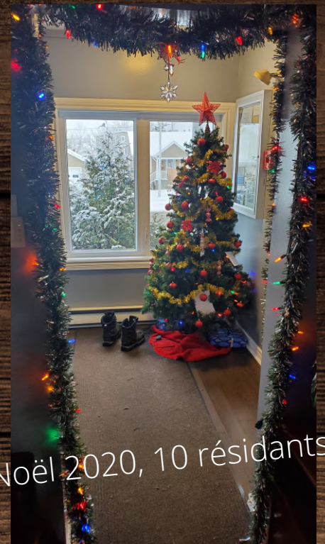
Noël 2020, 10 résidents!