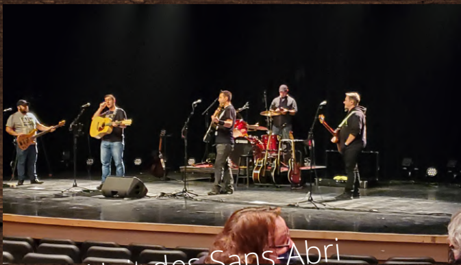
Nuit des Sans-Abris