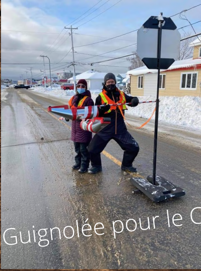
Guignolée pour le CASI